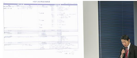
会計報告・予算計画