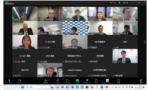
Zoomご参加キャプチャ

総会修了後の懇親会は、横浜グランドインターコンチネンタルホテルの横浜ベイの夜景がきれいな会場「エーグ」の間でで行われました。